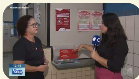
TV Atalaia - O projeto da Ciclo Fraterno estão com uma campanha de combate a pobreza menstrual