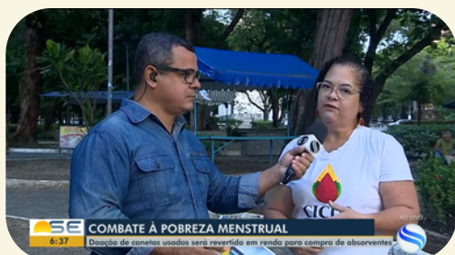
TV Sergipe - Doação de canetas no combate à pobreza menstrual

Em parceria com o Projeto Tampas Pets, a Ciclo Fraterno iniciou o Coleta que Acolhe - projeto de coleta de materiais escolares usados . Por meio da entrega do material coletado a empresa responsável pelo descarte adequado foi possível obter um valor de compensação que possibilitava a compra de produtos menstruais. Infelizmente a empresa responsável pelo descarte desativou o recolhimento de materiais escolares, desativando assim o projeto. Porém a Ciclo Fraterno mantém a divulgação da iniciativa do Tampas Pets para outros produtos recicláveis e o projeto permitiu divulgar a nossa organização na mídia.